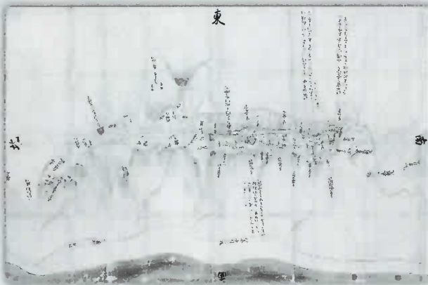
▲ 備中松山城図(遠州築造計画図) 近江孤蓬庵蔵