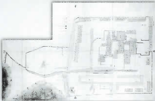
▲ 小室陣屋指図 佐治家資料