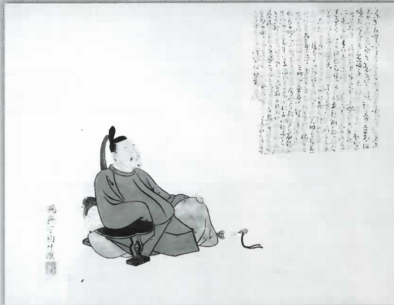
▲ 小堀遠州像

〒526-0065 滋賀県長浜市公園町10番10号 TEL 0749-63-4611 FAX 0749-63-4613