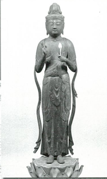
▲ 木造聖観音立像 竹生島宝厳寺蔵

〒526-0065 滋賀県長浜市公園町10番10号 TEL 0749-63-4611 FAX 0749-63-4613