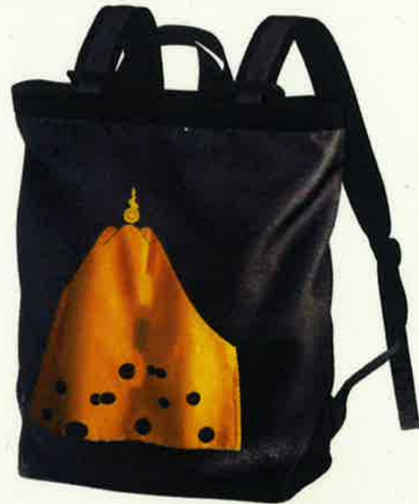
特別販売！ 長浜限定「富士御神火文」デザインリュック