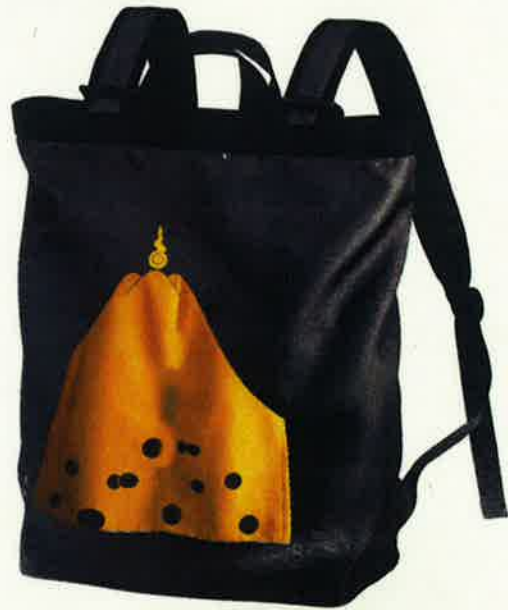
特別販売！ 長浜限定「富士御神火文」デザインリュック