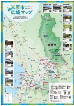
まいばら観光ガイドマップ