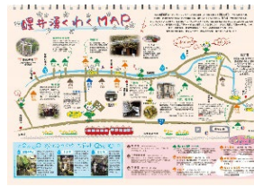
醒井湧くわくマップ