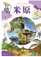
米原市観光ガイド