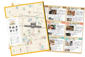
米原駅周辺グルメマップ