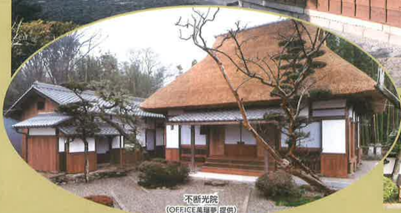
不断光院