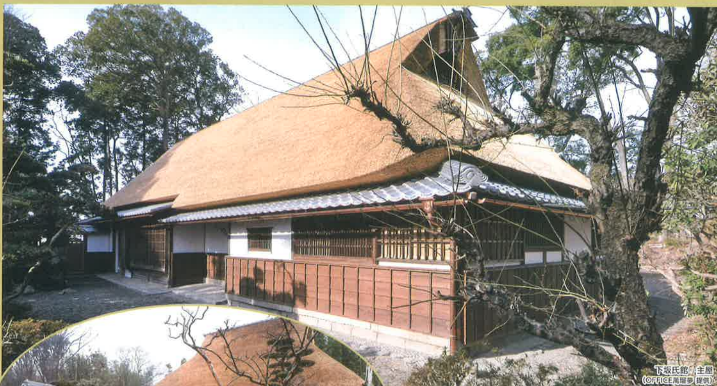
下坂氏館跡 主屋

Historic site Shimosaka clan's residence